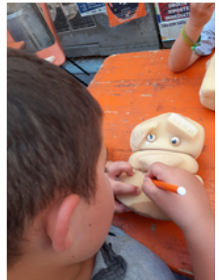
Labo Mario à Crest en Août 2020

La compagnie du Bruit dans la Tête propose un système constructif simple et très expressif de marottes en mousse et tissu. En 2h chaque enfant aura créé sa marionnette. Il pourra ensuite la mettre en jeu grâce au canevas scénographié du « Ramdam des Zytros ».